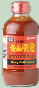
SALSA KIMCHEE 6X450G MOMOYA