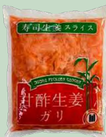
JENGIBRE/GARI ROSA 1KG AIYIDUO