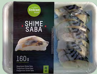
CABALLA MARINADA(SHIME/SABA) (20X8G) 160G