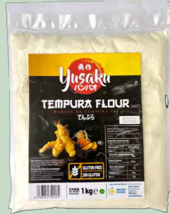
HARINA TEMPURA SIN GLUTEN 10 X 1KG. YUSAKU