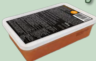
MASAGO ORANGE 12X500GR EXKIMO (Huevas de Capellan)