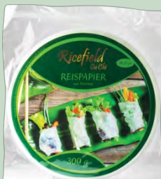
OBLEA ARROZ 22CM 10 X 300 GR RICEFIELD