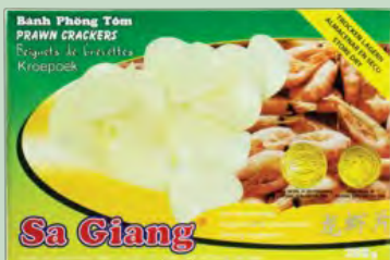
PAN DE GAMBAS 55X200G SAGIANG