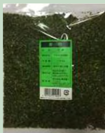
ALGA NORI EN POLVO 200GR AO NORI