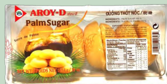
AZUCAR DE PALMA AROY-D 454GR