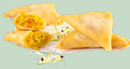
SAMOSA VEGETAL CURRY 2GR 10x50UND