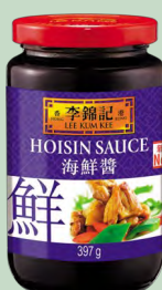
SALSA HOISIN FCO 12X397G LKK