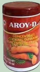
TAMARINDO CONCENTRADO 454GR AROY-D