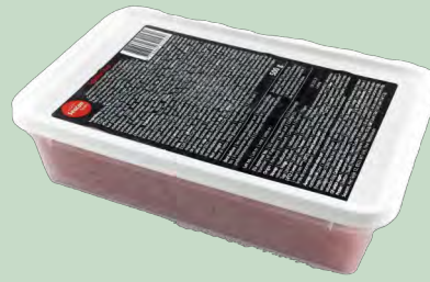
TOBIKO ROJO 12X500G (HUEVAS DE PEZ VOLADOR)