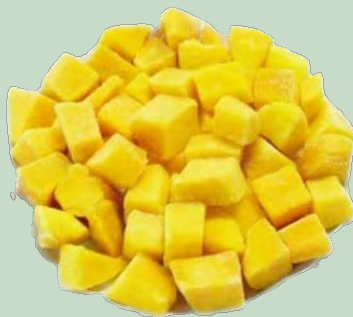
MANGO DADOS CONG. 1KG