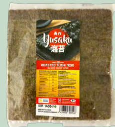
ALGA SUSHI NORI GOLD 10 X 50 YUSAKU