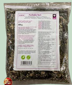
FURIKAKE NORI 450G. GLOBE GOURMET