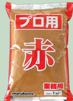
MISO ROJO 10X1KG MARUKOME