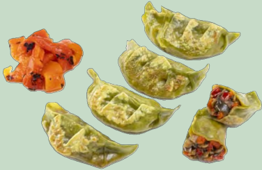
GYOZA VERDURAS 20GX30U 8X600G IDG