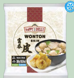
PASTA WONTUN 9CM 9UX300G HAPPY BELLY