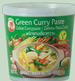
PASTA CURRY VERDE 400GR COCK BRAND