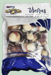
VIEIRA (ZAMBURIÑA) 10/20 10X1KG