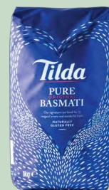
ARROZ BASMATI BOLSA 1KG