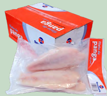
PANGA FILETE 170/220 6X1KG (800G) SEAWORK