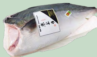
HAMACHI (PEZ LIMON) KG