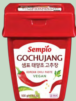
PASTA CHILI GOCHUJANG 12X500GR SEMPIO