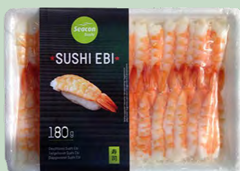
SUSHI EBI COCIDO 4L 20X195G