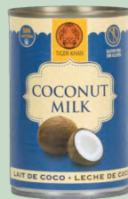
LECHE DE COCO 400ML TIGER KHAN