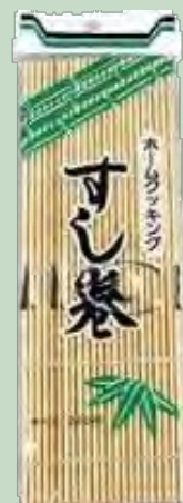
ESTERILLA MAKISU 24X24 UND