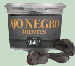
AJO NEGRO PELADO