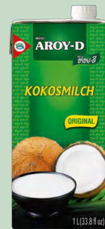
LECHE DE COCO PARA COCINAR 12X1L AROY-D