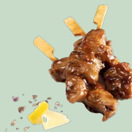
MINI BROCHETA YAKITORI SATAY 30GX50U 1,5KG