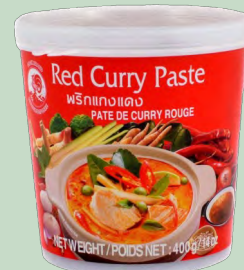
PASTA CURRY ROJA 400G AROY-D