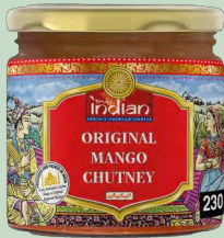
SALSA MANGO CHUTNEY 230G TRULY INDIAN