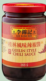
SALSA CHILI BEAN SAUCE LKK 12 X 368G