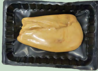
ESCALOPE FOIE ENTERO RESTAURACION