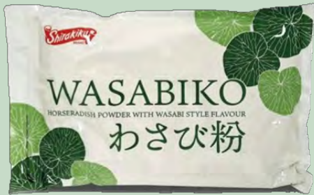
WASABI EN POLVO 10X1KG KINJIRUSHI