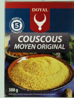
COUSCOUS MEDIANO 12X500G DOYAL