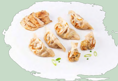
GYOZA POLLO ASADO 20GX30U