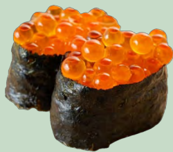
IKURA HUEVAS DE SALMON