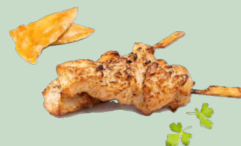
BROCHETAS PECHUGA POLLO ASADA 5X1KG IDG