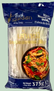
TALLARINES DE ARROZ 5MM 12 x 375GR THAI GARDEN