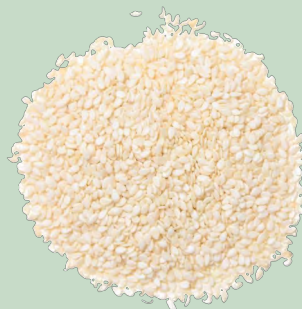
AJONJOLI GRANO BLANCO (SESAMO) 910GR