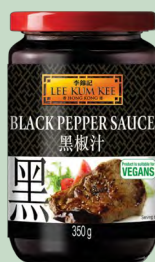
SALSA BLACK PEPPER 12X350G LKK