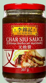
SALSA CHAR SUI BBQ LKK 12 X397G