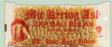
WONTON NOODLES INDONESIA 20X200G BALI BULAN