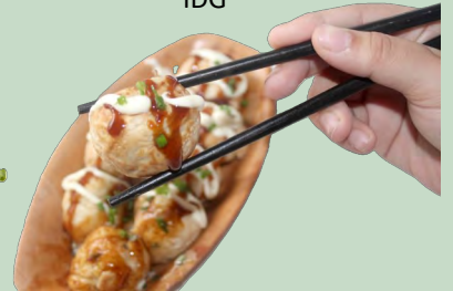
TAKOYAKI 500GR (BOLAS DE PULPO) 25PIEZ.