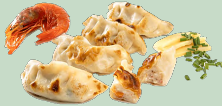
GYOZA MARISCO 20GX30U 8X600G IDG