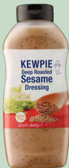
SALSA SESAMO GOMA DRESING 6 X 930ML KEWPIE