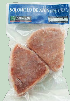
ATUN SOLOMILLO 2*112GRS. 12uds