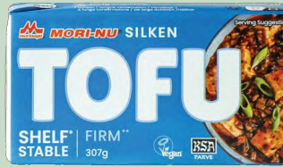
TOFU FIRME 12x 307 GR MORINU