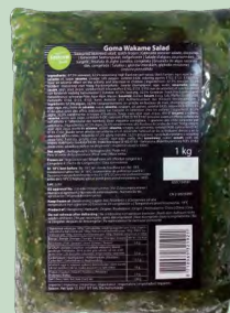
WAKAME "ALGAS" 10X1KG