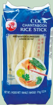
TALLARINES ARROZ 10MM 30X375G COCK THAILAND