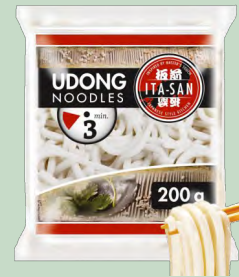
FIDEOS UDON AIYIDUO 30 x 200G