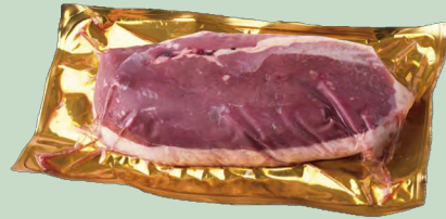
MAGRET DE PATO