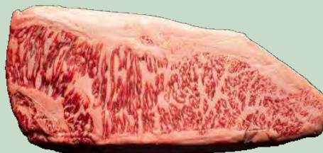
LOMO BAJO WAGYU