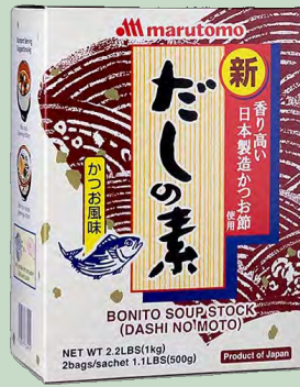
DASHI NO MOTO MARUMOTO 1KG