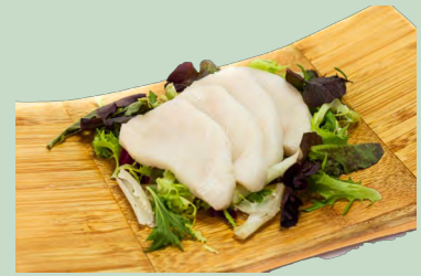
PEZ MANTEQUILLA KG