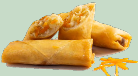
ROLLITO DE PRIMAVERA 40GR X 100UD