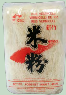
NOODLES ARROZ VERMICELLI 24X454G FARMER