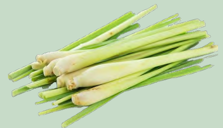
LEMON GRASS CONG. 200GR (50UD)