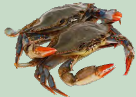
CANGREJO BLANDO CRAB KG 14P PRIME KG 18P HOTEL