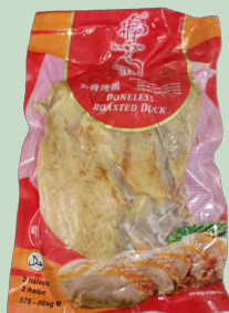
PATO ASADO DESHUESADO 16X625G