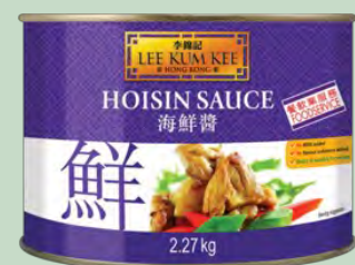
SALSA HOISIN 6 X 2,27KG LKK