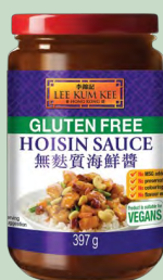
SALSA HOISIN S/GLUTEN 12X397 LKK