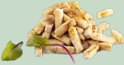
TIRAS DE POLLO ASADAS