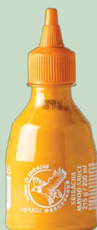
MAYONESA SRIRACHA 6 X 215G UNI-EAGLE