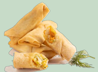
MINI ROLLITO DE PRIMAVERA 10X60Und