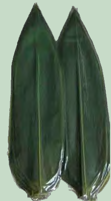
HOJAS DE BAMBU PAQ-100U