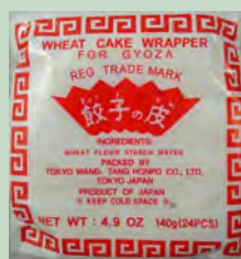
OBLEA PASTA GYOZA NO KAWA 8CM 30UD