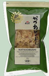
KATSUOBUSHI (COPOS BONITO) 60GR