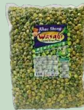
GUISANTES WASABI 10 X 1 KG