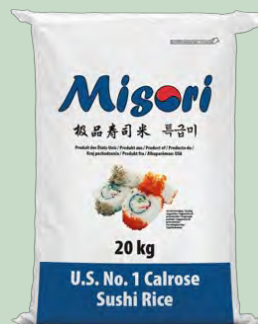
ARROZ MISORI GRANO MEDIO 20 KG