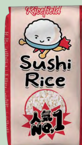
ARROZ SUSHI GRANO CORTO 10X1KG RICEFIELD