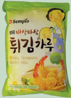
HARINA TEMPURA 10 X 1KG. SEMPIO (SOUTH KOREA)