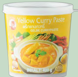
PASTA CURRY AMARILLA 400GR COCK BRAND