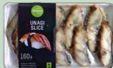
UNAGI KABAYAKI (ANGUILA) LONCHA BJA 25X160G