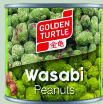
CACAHUETES WASABI GOLDEN TURTLE 12 X1 40G