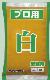
MISO BLANCO 10X1KG MARUKOME