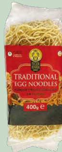
NOODLES ORIGINALES TIGER KHAN 12 x 400GR