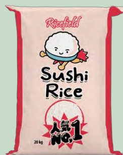
ARROZ SUSHI GRANO CORTO 20 KG RICEFIELD (VIETNAM)