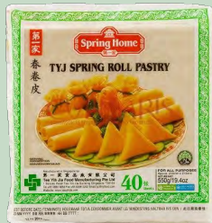
PASTA ROLLITO 21.5X21.5MM 40HOJAS