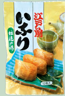
TOFU FRITO 30x 240 GR INARI