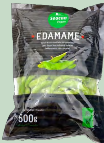
EDAMAME VAINA CONG. 20X500GR TIGER KHAN