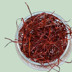
CHILI RALLADO ITO TOGARASHI 100GR