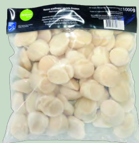
CARNE DE VIEIRA HOTATE 10/20 10X1KG (800G)