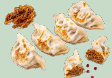
GYOZA PULLED PORK 20GX30U 8X600G IDG