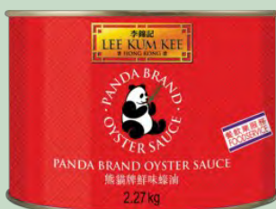
SALSA DE OSTRAS 6 X 2,27KG LKK