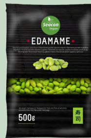
EDA- MAME PELADO CONG. 20X500GR