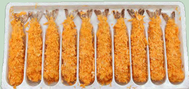
EBI FRY 2L (LANGOSTINO) 50U 1X6EST.