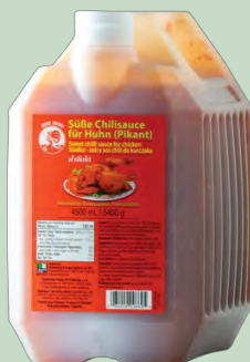
SALSA CHILI DULCE DE POLLO 3 X 4.5L COCK BRAND