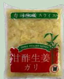
JENGIBRE/GARI BLANCO 1KG. AIYIDUO