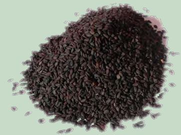
AJONJOLI GRANO NEGRO (SESAMO) 910G