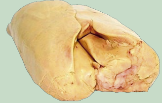
ESCALOPE FOIE ENTERO DESVENADO