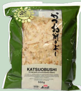
KATSUOBUSHI (COPOS BONITO) 500G.