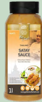
SALSA SATAY 6 X 1L GOLDEN TURTLE