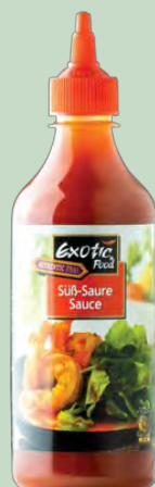
SALSA AGRIDULCE 12 X 540G EXOTIC FOOD TAHILAND