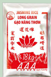
ARROZ JASMINE 100% LONG GRAIN 18KG VIETNAM