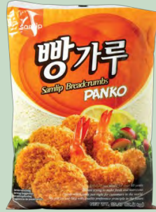
PANKO 10 X 1KG. SAMLIP (SOUTH COREA)