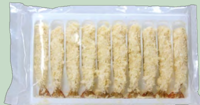
SUSHI EBI FRY 3L 30G 10X300G