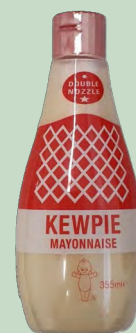
MAYONESA JAPONESA 6 X 355ML KEWPIE