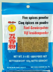
CINCO ESPECIAS CHINAS 4X25X100G MEE CHUN