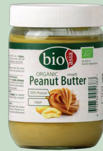
PASTA DE CACAHUETE S/AZUCAR 450GR