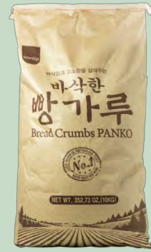
PANKO 10KG SAMLIP (SOUTH COREA)