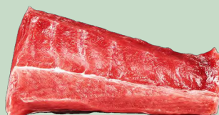
ATUN TACO CHIGIMI S/SANGRE ATM 2.5-3.5KG