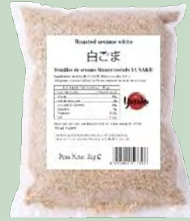
SESAMO TOSTADO YUSAKU 1KG