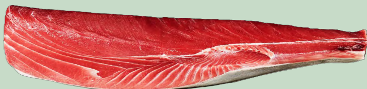
ATUN LOMO LARGO MURAMASA 3-5KG