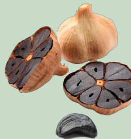
AJO NEGRO CABEZAS