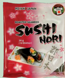
ALGA NORI HOJAS 10 X 26G MIYAKO