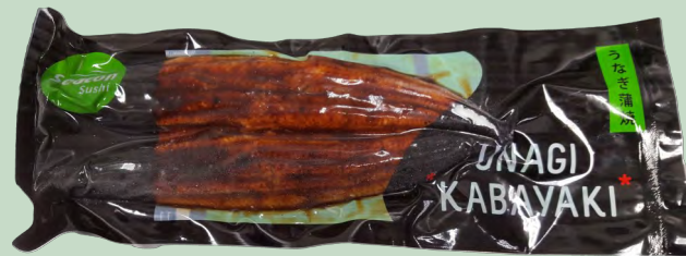
ANGUILA KABAYAKI FILETE 255G 1X5KG