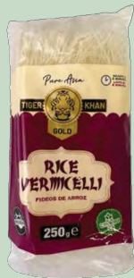
FIDEOS ARROZ VERMICELLI TIGER KHAN 12 x 250G