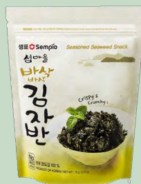
SNACK DE ALGAS CRIJUENTES 50GR SEMPIO