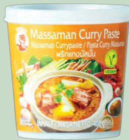
PASTA CURRY MATSSAMAN 24X400GR COCK